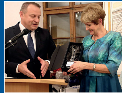
Gratulacje od Zbigniewa Paprockiego, Dyrektora Generalnego Grupy Azoty