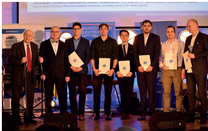
Laureaci konkursu na prace dyplomowe z optoelektroniki