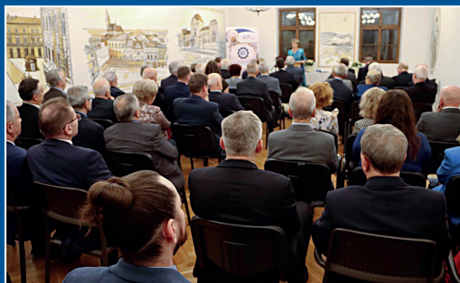
Sala konferencyjna w Domu Technika