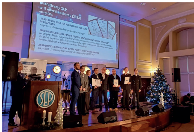
Laureaci konkursu „mikroGranty”

Zalicza się do nich konkurs przeznaczony dla młodzieżowych kół SEP – „mikroGranty”. Polega on na wyborze najlepszych inicjatyw przygotowanych przez koła uczniowskie i studenckie działające w strukturach Stowarzyszenia oraz na przyznaniu najlepszym wnioskowi dofinansowania w postaci mikroGrantów na realizację zaplanowanych projektów. Sto-