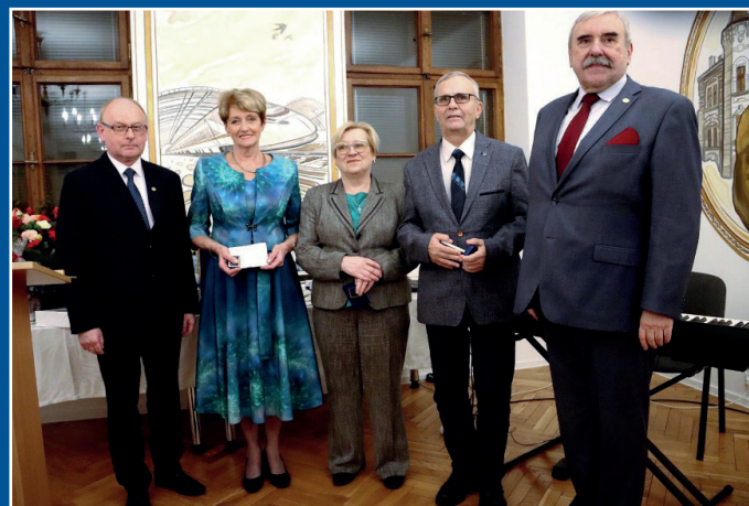
Odznaczeni Srebrną Odznaką Honorową NOT