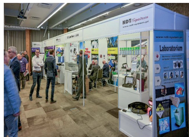
Wystawa towarzysząca 50. KKBN