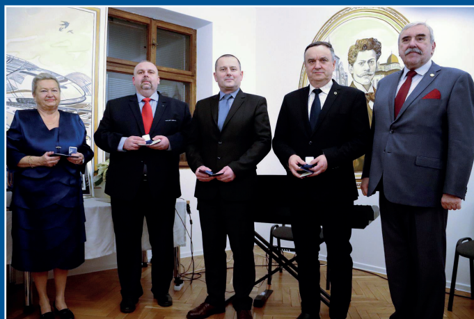
Odznaczeni Złotą Odznaką Honorową NOT